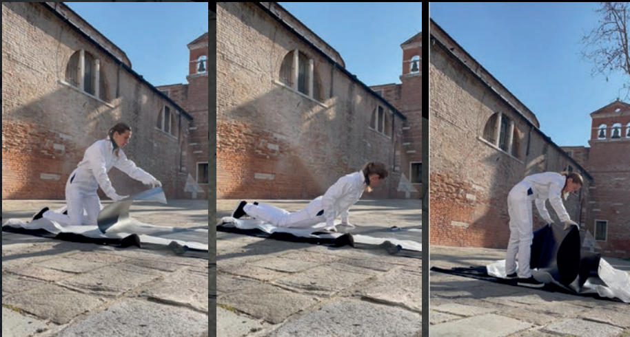
Folding Happening / Venice / Campo S. Agnese / march 2022