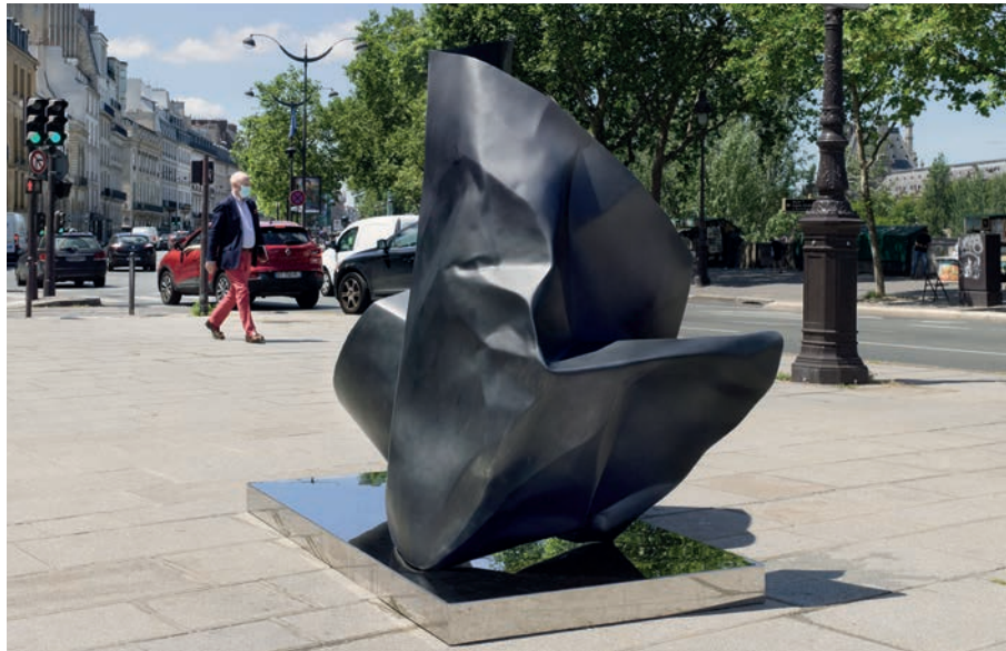
Installation pendant 1 mois, quai Malaquais (face au Louvre), dans le cadre du "Parcours St Germain", une exposition collective aux côtés de Ugo Rondinone, JR, anonymous project, William Mackrell...

Plis de la mémoire III Bronze L200 x H220 x P100 cm (pièce unique) "The instant present is already past" / "Folded in what precedes, folded into what follows" Gilles Deleuze