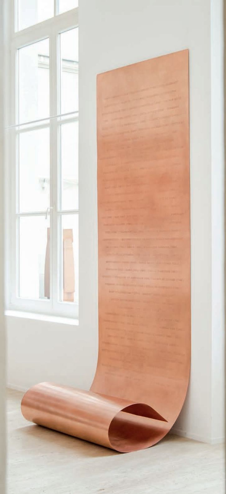
Les éclipsées CII plaque de cuivre, taille dépliée 100 x 380 cm (édition de 3, plage unique) Exposition collective / Maison d'Art (Paris) / avril 2023

OM (1862) / IMOGEN CUN ANNAPURNA DUTTA (1894) / L 397) / VOULA PAPAIOANNOU S // LAURA CERETA (1469) / A (1490) / GASPARA STAMP RATA FONTE (1555) / ISA INE DE BERRY (1798) / P