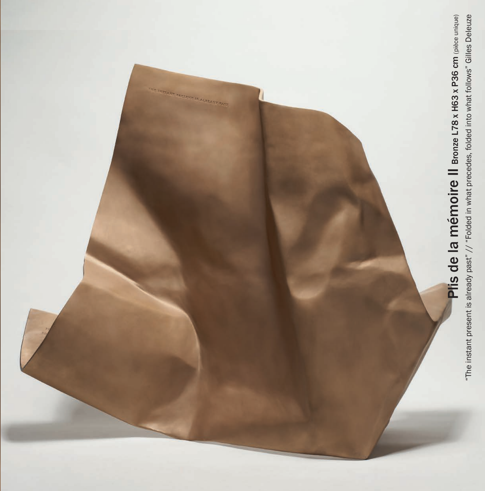
Plis de la mémoire II Bronze L78 x H63 x P36 cm (pièce unique) “The instant present is already past” // “Folded in what precedes, folded into what follows” Gilles Deleuze