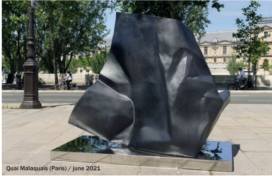
Quai Malaquais (Paris) / june 2021