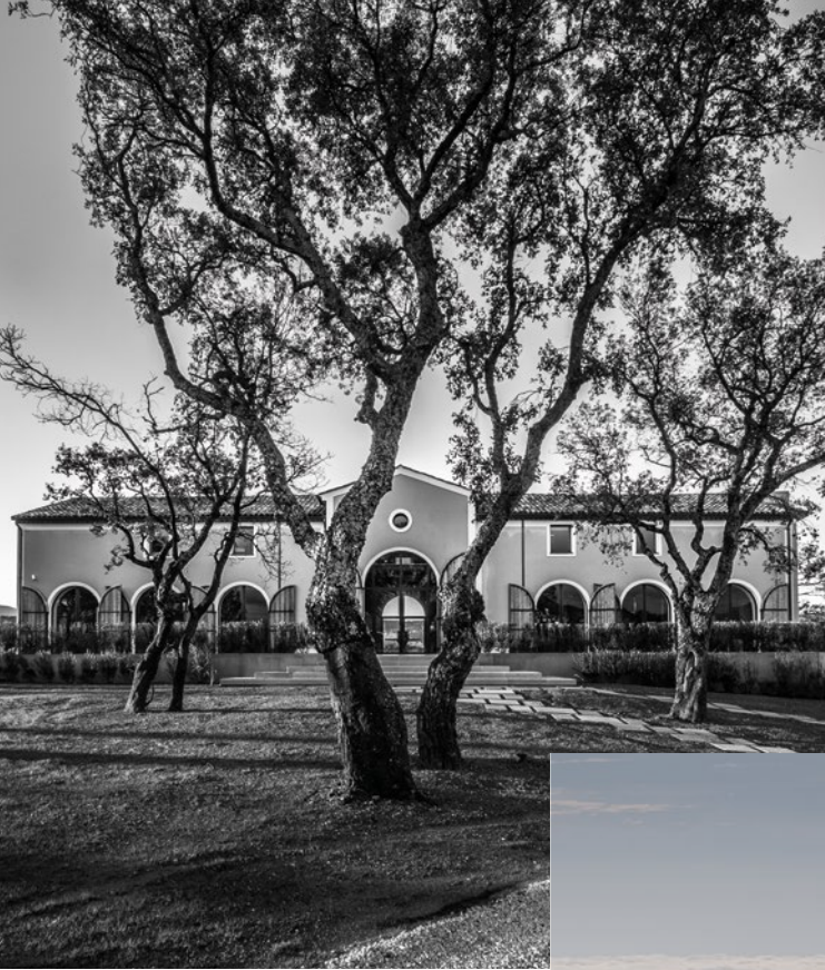
Château Saint-Maur Cru Classé Golfe de Saint-Tropez, France